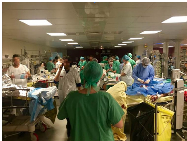
Fig. 4 Salle de surveillance postinterventionnelle (SSPI) de l'hôpital Saint-Louis, nuit du 13 au 14 novembre 2015.

On constate que l'implication des deux SU dans ce processus a été intense mais aussi relativement limitée dans le temps (une douzaine d'heures). Il a donc fallu dans cet intervalle s'adapter à l'ampleur de la situation en associant à la fois plus de vitesse et de la démultiplication (« changement