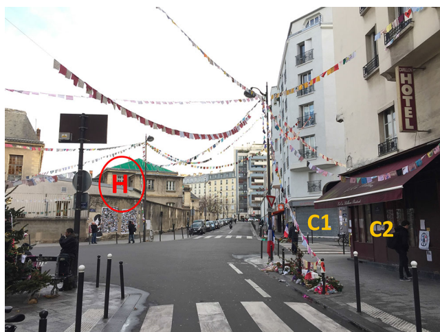
Fig. 2 Illustration de la proximité des cafés « Le Petit Cambodge » (C1) et « Le Carillon » (C2) par rapport à l'enceinte de l'hôpital Saint-Louis (H)

De 21h47 le 13 novembre à 3h38 le 14 novembre, 45 patients blessés par balles sont arrivés au SU de l'hôpital Saint-Antoine et 26 à l'hôpital Saint-Louis. Parmi eux, six ont été triés en urgences absolues (UA) et 39 en urgences relatives (UR) sur Saint-Antoine et 11 UA, 15 UR sur Saint-Louis. Les patients étaient amenés parfois à plusieurs dans le même véhicule. Les principales caractéristiques concernant le sexe, l'âge, le mode de transport, l'orientation à l'issue du passage des urgences et le devenir sont indiquées dans le Tableau 1. Les 71 patients reçus dans les deux hôpi-